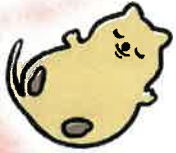
こころをつなぐ マスコット ここちゃん